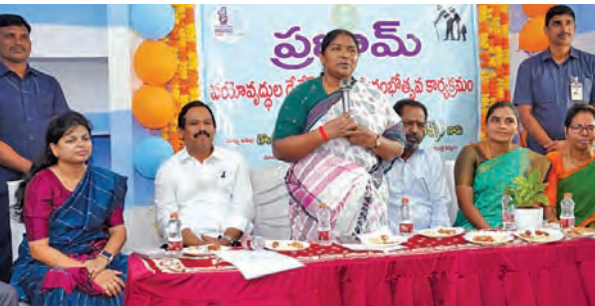
మాట్లాడుతున్న మంత్రి సీతక్క