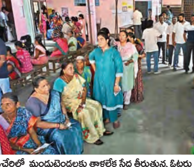
అసోంలో ఓ పోలింగ్ కేంద్రం వద్ద బారులు తీలిన ఓటర్లు, కేరళలో ఓటువేసేందుకు వచ్చిన సభజంబు, పాండిచ్చేరిలో మందవరం దళాలతో సేద తీసుకున్న ఓటర్లు