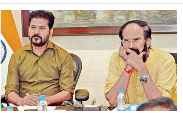
గురువారం కాళేశ్వరంపై సమీక్షలో సిఎం రేవంత్, మంత్రి ఉత్తమ

జూన్ 2 నుండి ఇందిరమ్మ బీమా రైతుల అభివృద్ధి లక్ష్యంగా సాగునీటి వనరుల విస్తరణ విద్యార్థుల అభ్యున్నతికి ప్రభుత్వం కృషి ఈ విద్యా సంవత్సరం నుండి విద్యార్థులకు అర్హులైన మధురలో అభివృద్ధి పనులకు శ్రీకారం: డి.సిఎం భట్టి