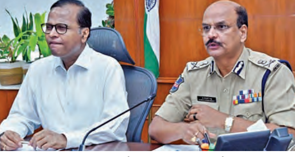
గురువారం సచివాలయంలో నిర్వహించిన సమీక్షలో సిఎస్, డిజిపి

స్థానిక పరిస్థితులకు అనుగుణంగా పరిష్కారం కనుగొనాలి అధికారులకు సూచించిన సిఎస్, డిజిపి 13 నుంచి 18 వరకు నిర్వహించే అర్లెవ్ అర్లెవ్ కార్యక్రమాలపై ఉన్నత సమీక్ష