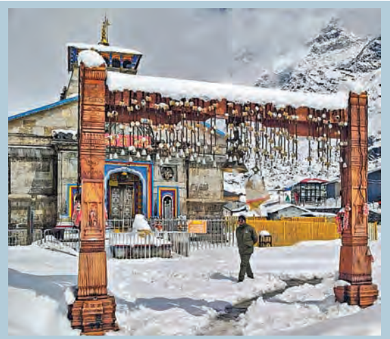
గురువారం మంచుడుపట్టిలో ఉత్తరాఖండ్ లోని కేదార్ నాథ్ ఆలయం