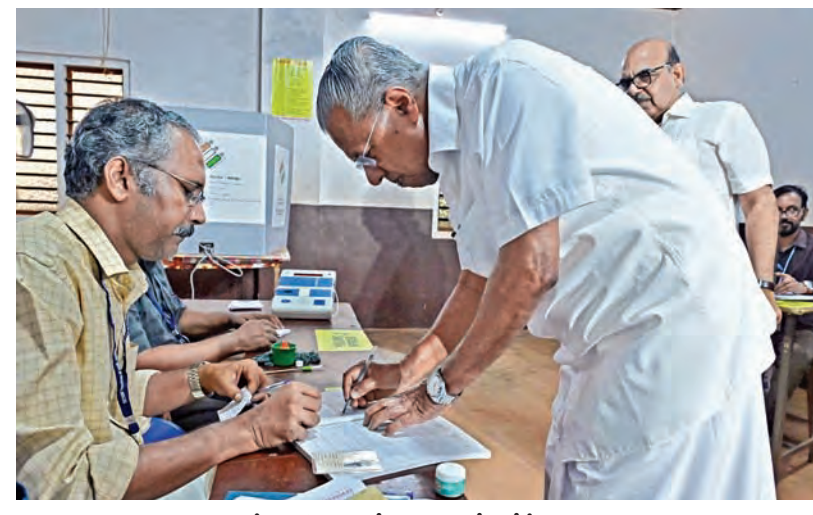
గురువారం తిరువనంతపురంలోని ఓ పోలింగ్ కేంద్రం వద్ద వేటువేసేందు వచ్చిన సిఎం పిసరమ్ విజయన్